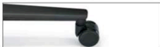
Schwarz pulverbeschichtet Powder coated black

Fußkreuz farbgleich mit Rückenverbinder Base same color as back connector