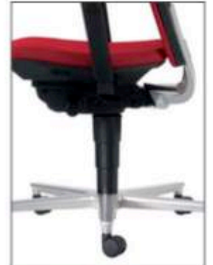
Teleskopabdeckung (Option) Telescopic cover (option)