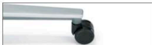
Silber pulverbeschichtet Powder coated silver