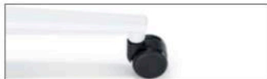
Weiß pulverbeschichtet Powder coated white