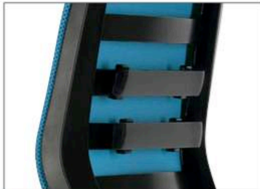
Höhen- und tiefenverstellbar Height and depth adjustable