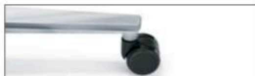
Aluminium poliert Aluminium polished